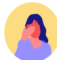
Dolor de cabeza