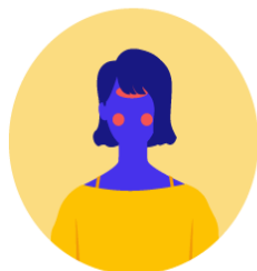
Fiebre sobre 37,8°

Si un colaborador presenta alguno de los siguientes síntomas: