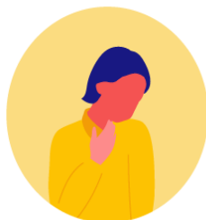
Dificultad para respirar (a diferencia de un resfriado)